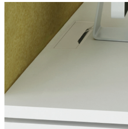
Столешница с вырезом для крышки и подключения проводов