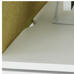
Столешница с дугообразным вырезом для подключения проводов